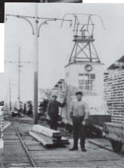
Posering framför tåget