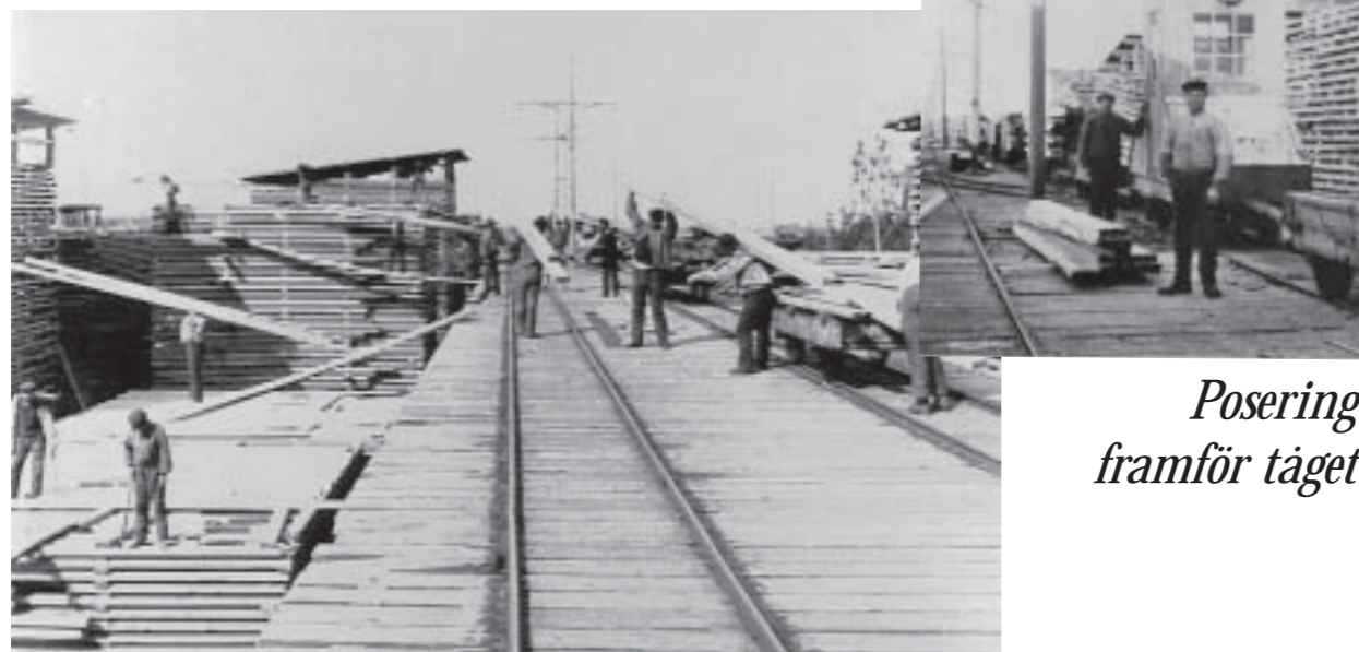
Arbete i brädgården