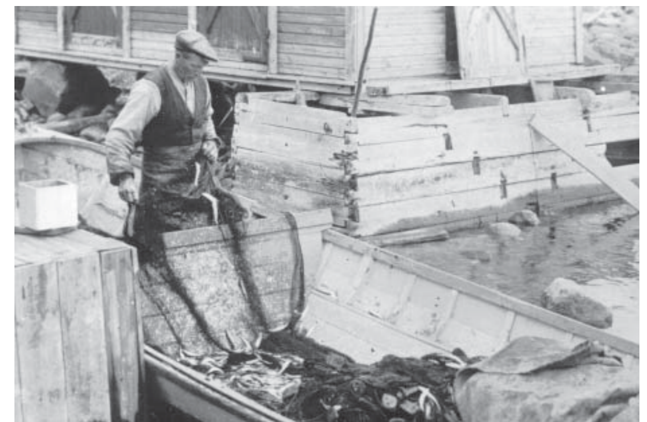
Stabbläggare skakar näten

Freizeithäuser und Bootshäuser Viele Inselbewohner ließen auf nahegelegenen Inseln Freizeithäuser bauen. Die Gegend war an Fischerhütten und Bootshäusern reich, da der Fischfang für die Versorgung der Familien wichtig war. Hering wurde jeden Tag um 9 Uhr zum Frühstück genossen.