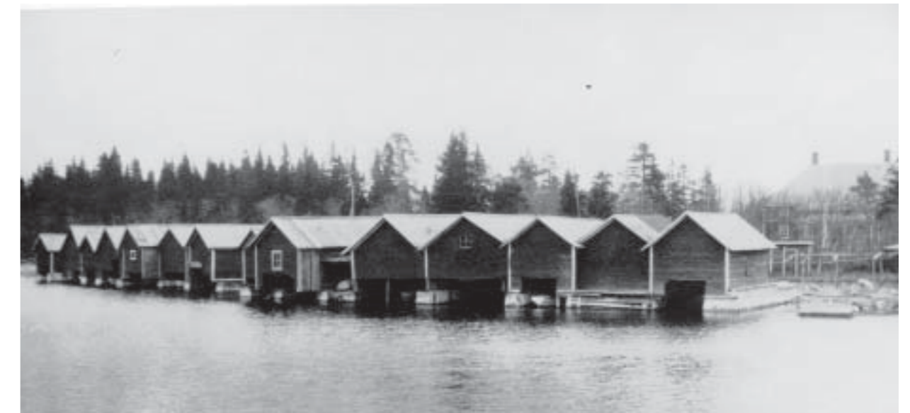
Tannskärsviken med ordenshuset i bakgrunden

Monet saarelaiset rakensivat lähisaarillekesäasunnon. Kala- ja venevajoja oli myös runsaasti, koska kalastusoli tärkeä osa perheiden toimeentuloa. Silakkaa syötiin aamiaisiksi joka päivä kello kymmenen.