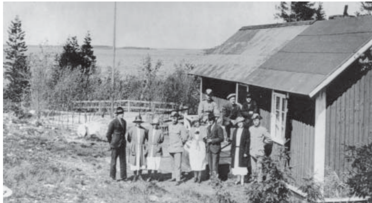
Utflykt till stugan på S:t Helena