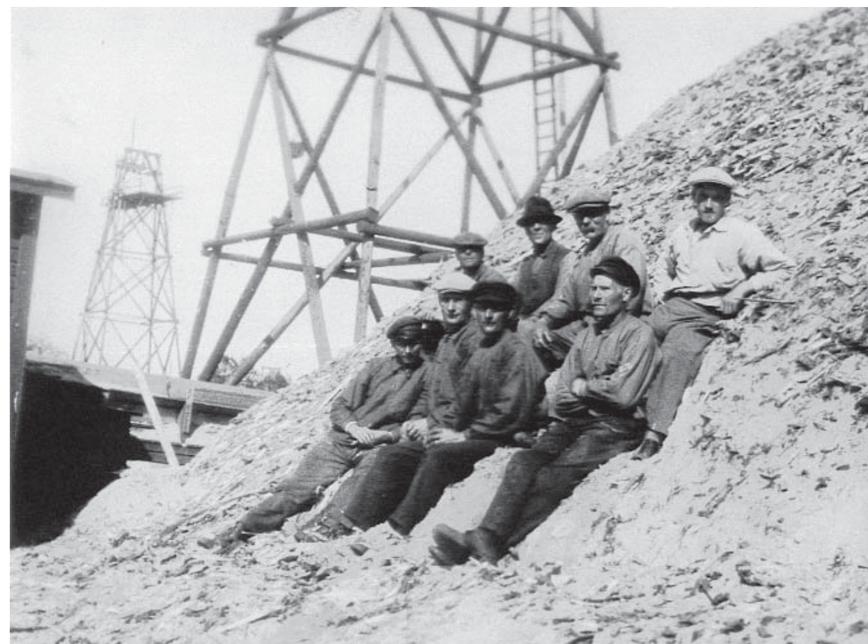
Arbetare tar igen sig i spånhögen

Linbanan byggdes samtidigt med det nya sågverket 1923 efter att den gamla sågen brunnit ner till grunden. Före 1923 togs sågavfallet till vara för produktion av småvirke till lådor, tunnor etc. En del kolades på Tannskär.