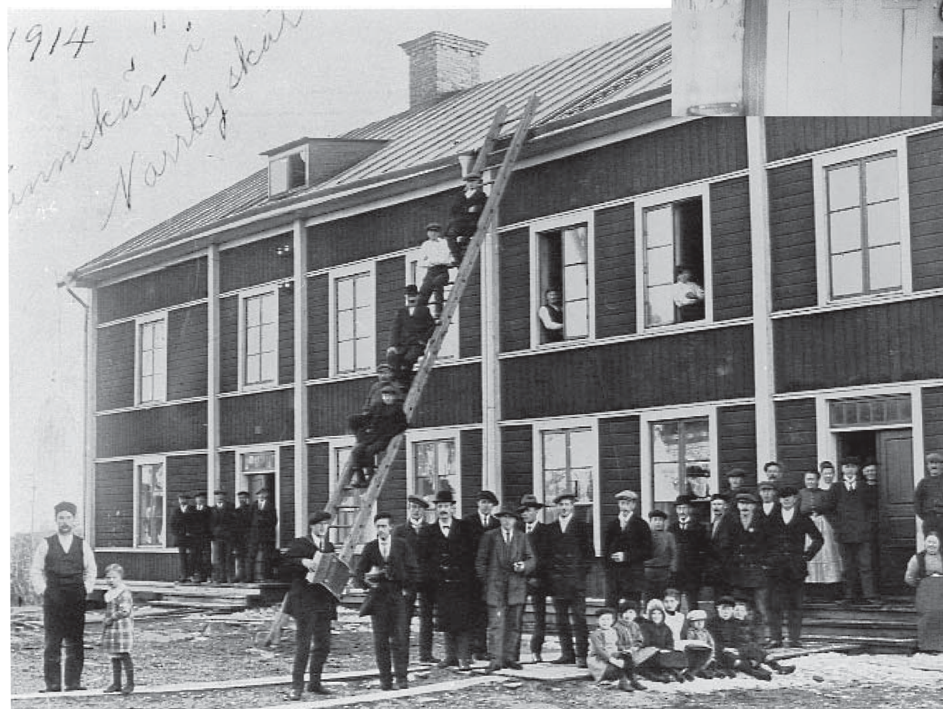
"Larissa" som också kallades "Tannskärsbyggninga"