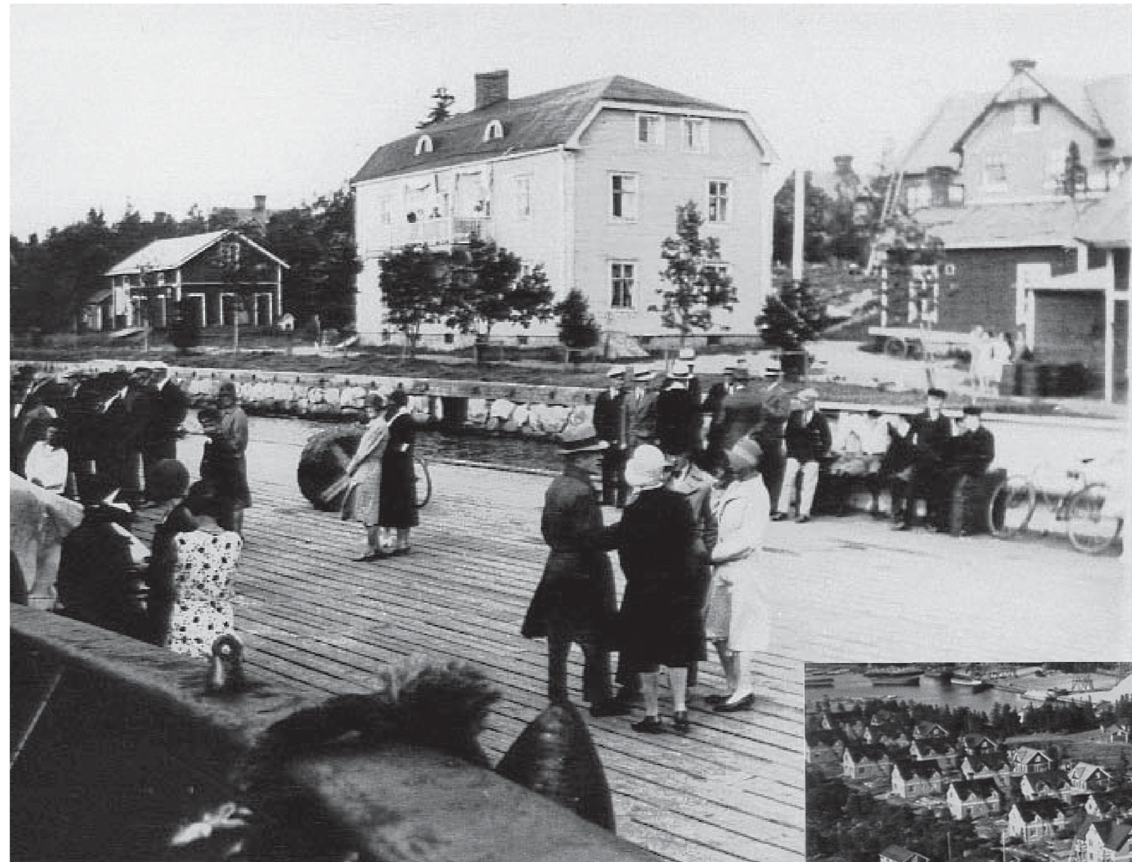
Stuguskärskajen med hotellet i bakgrunden

Handelsschiffe, Schiffe im Personenverkehr und Besucher - alle kamen sie am Kai von Stuguskär an, der während der wirtschaftlich aktiven Epoche des Sägewerks den Eintrittsplatz zu Norrbyskär ausmachte.