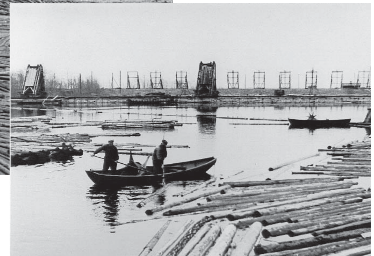
Arbete i timmerbommen 1942.